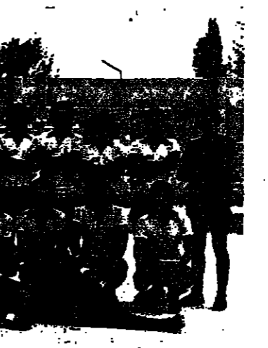
من لاسبي كتر قاسم على الحكم حول فرة جزء 11 . . ومسيبت الاتحاد العام في مسير هذه المباراة .

وهذ وقعت مفاجات كبرى بفوز فرق الدرجة الثالثة على فرق الدرجة الثانية . . وكانت الحاجة الكبرى فوز مكابي طرعان على هبوعيل نتانيل من فرق الدرجة الاولى سابقا وحاليا من الدرجة الثالثة . . كما فاز فريق هود هشرورن على شيايب يافا . . وخسارة جرجولية مع هشرورن نتانيا وغيرها من المفاجات .